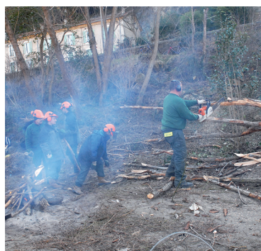
Travaux ANRU Alès

21 164 heures d'insertion en 2013 sur les actions PLIE Cévenol