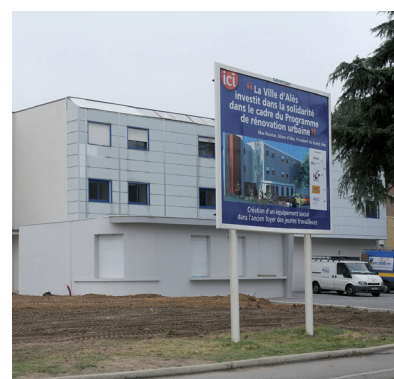
Travaux ANRU Près St Jean (Alès)