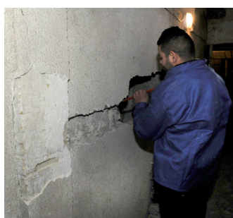
Logis Cévenol Alès