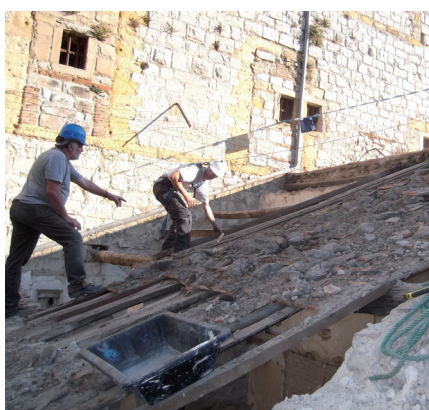
Chantier d'insertion réhabilitation Fort Vauban (Alès)