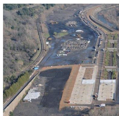
PRAE Humphry Davy La Grand'Combe