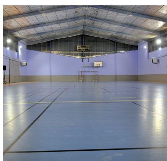
Gymnase Jean Macé Près St Jean (Alès)