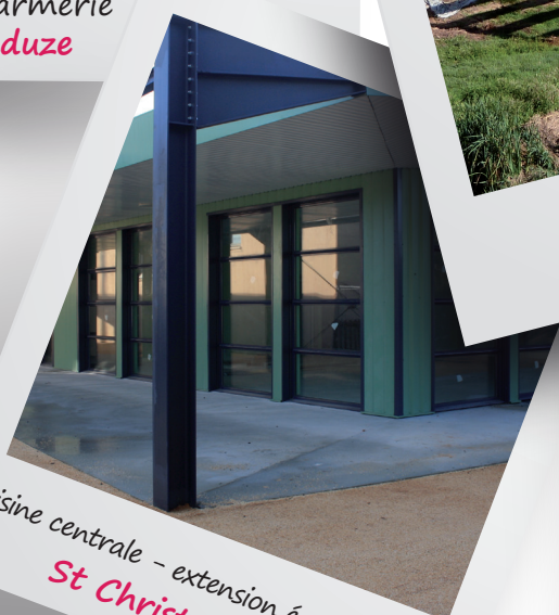
Cuisine centrale - extension école Marignac St Christol les Alès