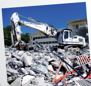
Démolition ancien hôpital Alès

26 557 heures d'insertion en 2012 sur les actions PLIE Cévenol