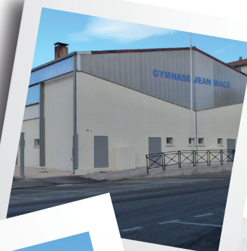
Gymnase ANRU - Alès