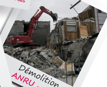
Démolition ANRU - Alès