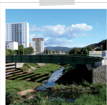
Pont de Grabieux ANRU - Alès

43 355 h prévues sur l'ensemble de la convention 34 115 h réalisées, soit 79 % des objectifs fixés (19 ETP) 41 demandeurs d'emploi missionnés au profit des habitants en ZUS 832 h C'est la durée moyenne des missions par participants, soit l'équivalent de 5,5 mois d'activités